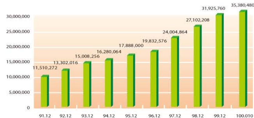
圖3：台灣IPv4位址成長統計(單位：個)

自治系統號碼(ASN)是一個提供自治系統(AS)間交換動態路由資訊的唯一識別碼。截至100年10月國內自治系統號碼核發數為308個。