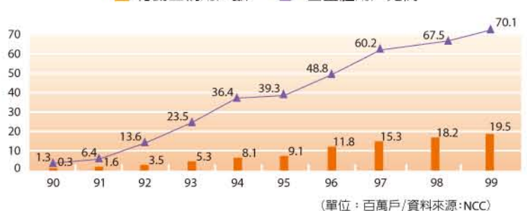
(單位：百萬戶)