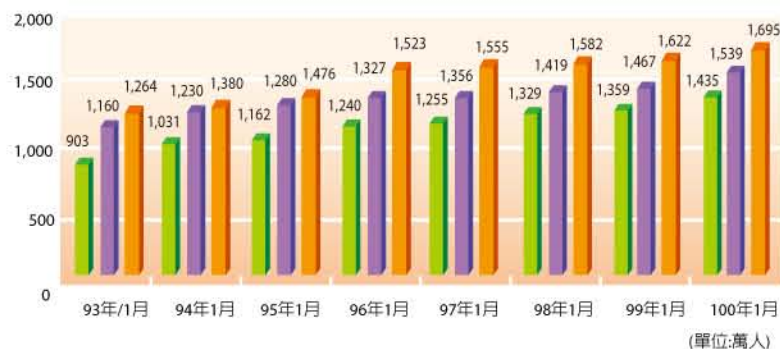
圖8：台灣上網人口統計