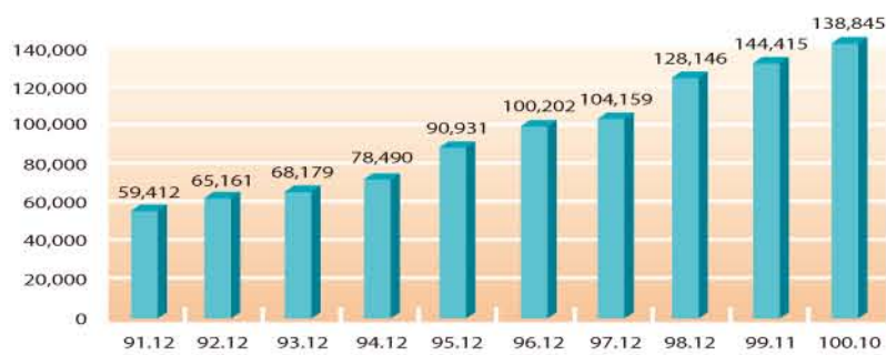
圖6：.tw WWW Server 數統計(單位:台)

.tw WWW Server數截至100年10月底共計有138,845台WWW Server。