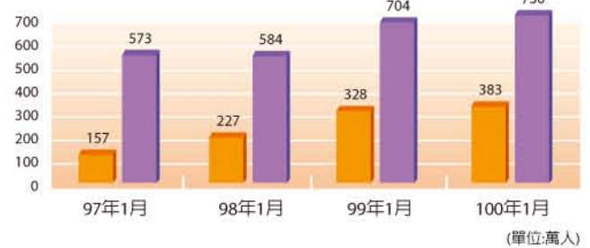
圖9：台灣12歲以上行動上網與無線上網人口統計