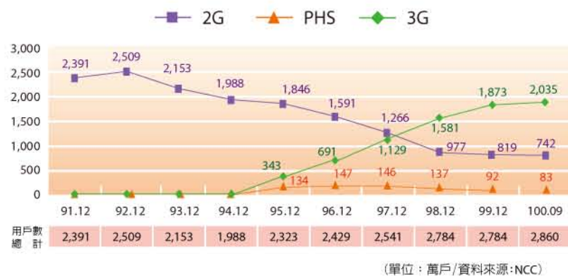
(單位：萬戶)