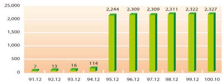
圖4：台灣IPv6位址成長統計(單位：/32)

網際網路位址(Internet Protocol Address)：指為供辨識網際網路主機號碼位置所在，以固定且單一的數字分配予主機之位址。台灣歷年來IP位址核發數量，呈穩定成長，IPv4位址發放數量統計，台灣居全球第13名；IPv6位址發放數量為全球第9名。