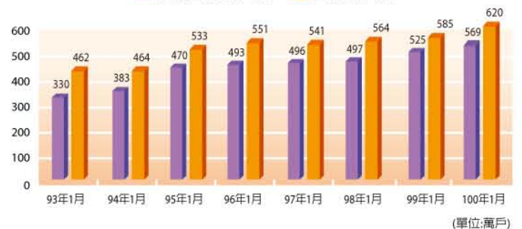
圖10：台灣上網家戶與寬頻上網家戶數統計