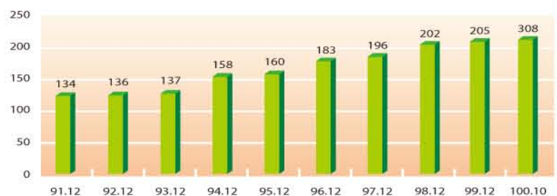
圖5：台灣ASN核發數量統計(單位：個)

自治系統號碼(ASN)是一個提供自治系統(AS)間交換動態路由資訊的唯一識別碼。截至100年10月國內自治系統號碼核發數為308個。