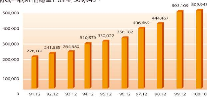
圖1：.tw網域名稱註冊成長統計(單位：個)

網域名稱(Domain Name)：指用以與網際網路位址相對映，便於網際網路使用者記憶TCP/IP主機所在位址之文字或數字組合。截至100年10月底止，.tw網域名稱註冊總量已達到509,943。